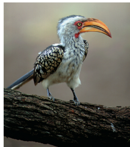
Neugieriger Gast im Elisenheim

Ankunft frühmorgens in Frankfurt und individuelle Bahnheimreise.