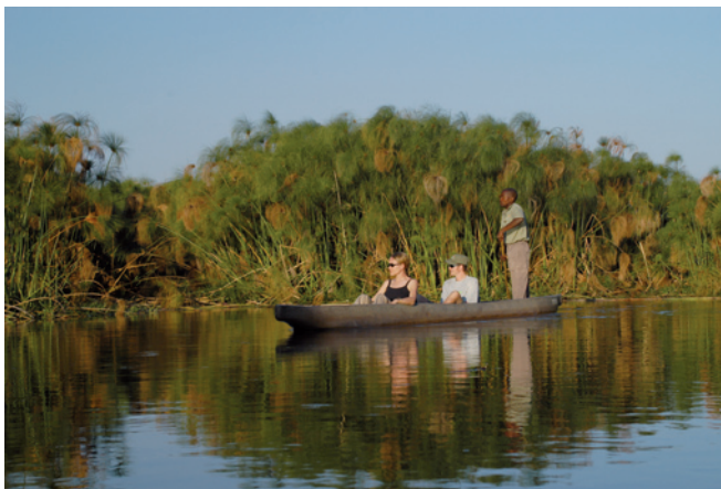
2 volle Tage in der Wasserwelt des Okavango-Deltas