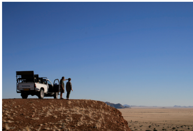
Unendliche Weite der Namib Wüste